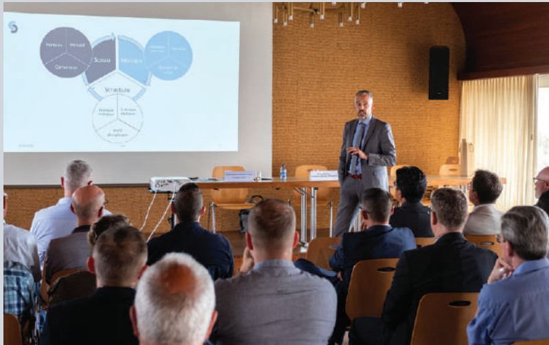
L'invité du 30 juin, M. Martin von Muralt, délégué de la Confédération et des Cantons pour le Réseau national de sécurité (RNS).

Un mandat général donné et financé par la Confédération et les Cantons à une structure appelée à rapporter, anticiper et analyser tous les événements en vue de conduire des stratégies nationales en termes de sécurité, y compris la gestion de crise. Cette structure est pilotée politiquement par deux conseillères fédérales (DDPS et DFJP) et deux présidents de conférences cantonales en charge de la police, de la justice et des affaires militaires, notamment.