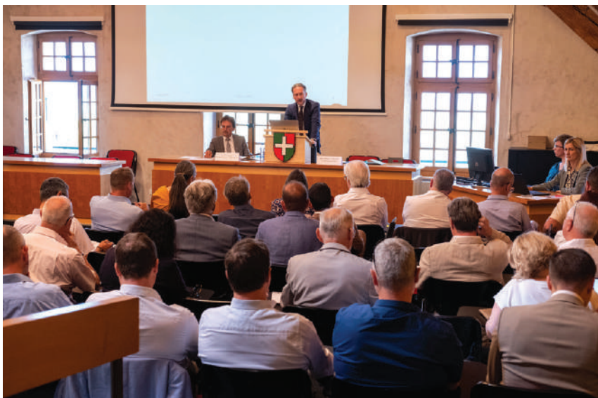
Les délégués de la CDPV réuni-es en assemblée générale à Ollon le 16 juin 2023.

nées de succès en termes de répartition de la facture policière (dès 2025 sous réserve d'une validation par le Grand Conseil cet automne). Sur un total de quelque CHF 71 millions, 65% seraient désormais à la charge des communes délégatrices (dont la sécurité est assurée par la Police cantonale) et 35% répartis entre toutes les communes vaudoises. Parmi elles, au bénéfice d'une police communale, 48 sont regroupées en huit régions auxquelles s'ajoute la