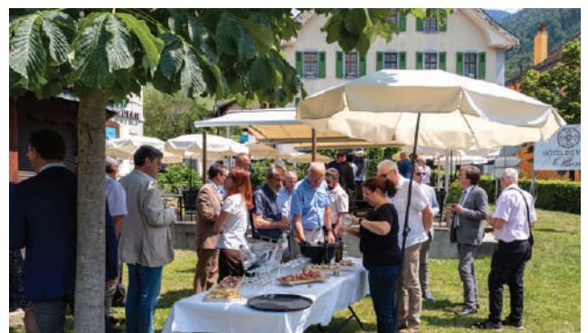
La partie festive des assises de printemps de la CDPV sous le soleil d'Ollon, où conseillères et conseillers municipaux, commandants de police et invité-es se sont retrouvés à l'issue des délibérations.